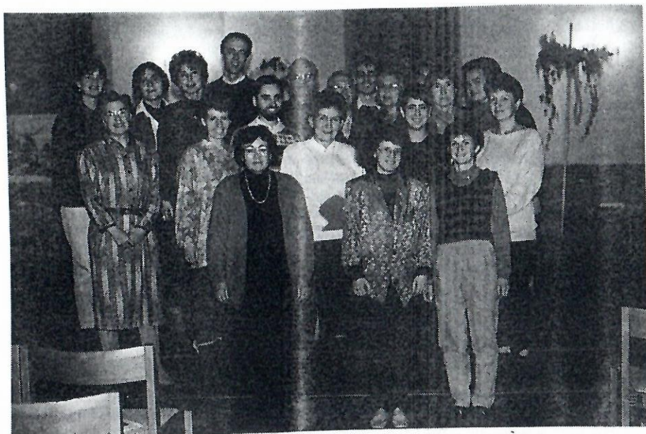
Die Kantorei heute (1992)

Singen und fröhliches Beisammensein sind heute wie früher ein Bedürfnis und wir hoffen gerne, dass der Chor seine Aufgabe im kirchlichen und musikalischen Leben der Gemeinde weiterhin erfüllen kann.