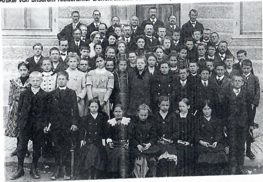
Foto: Die Choralrägergesellschaft um 1909