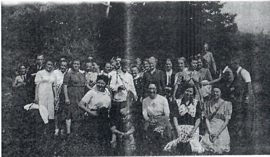
Diese Foto fand sich im alten Album des evangelischen Kirchenchores. Die Legende lautet Ausflug zur Rigi 1945 . Wer erkennt hier wen ?

An der Hauptversammlung des Kirchenchores vom 18. Januar 1945 erfolgte die formelle Auflösung der Sängergesellschaft: (Dokumentabschrift)